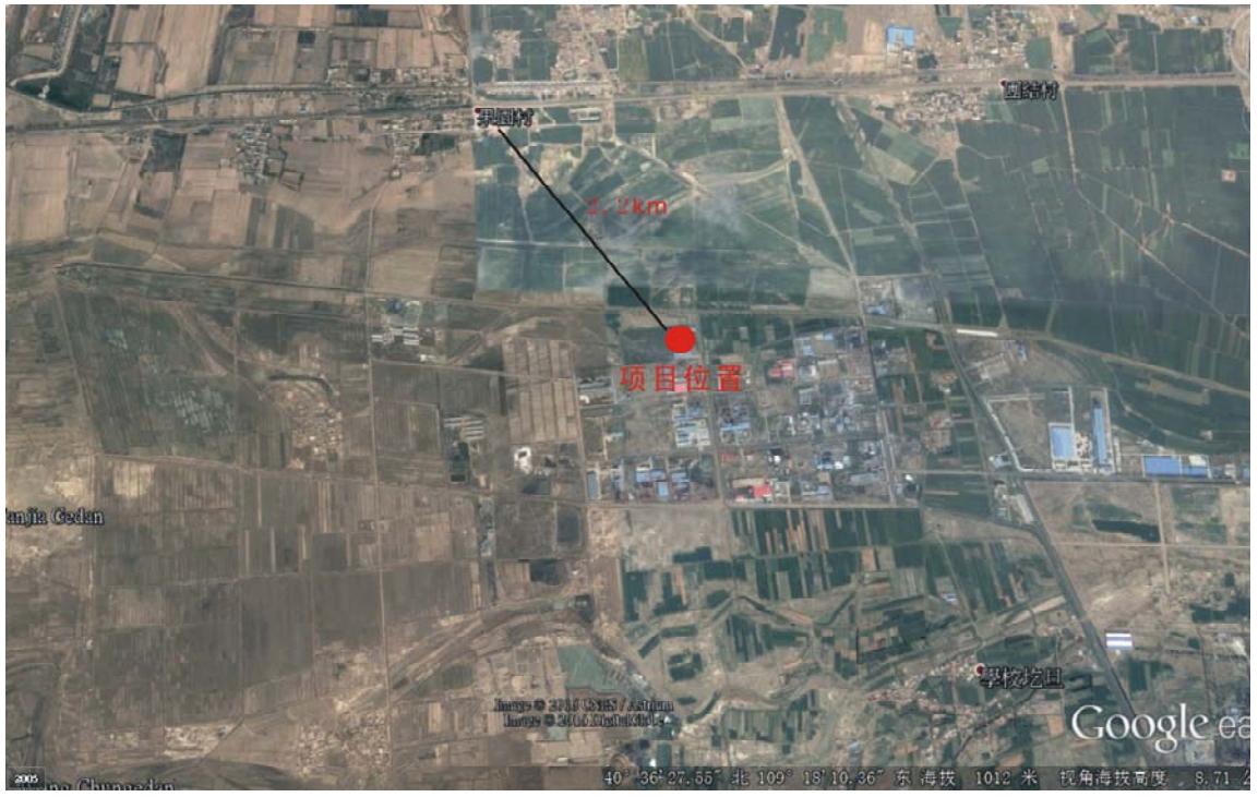
图 4 本项目环保目标图

项目区周边没有重点文物、自然保护区、珍稀动植物等重点保护目标。项目环境保护目标图见图 3 和表 17，项目周围环境状况图 4。