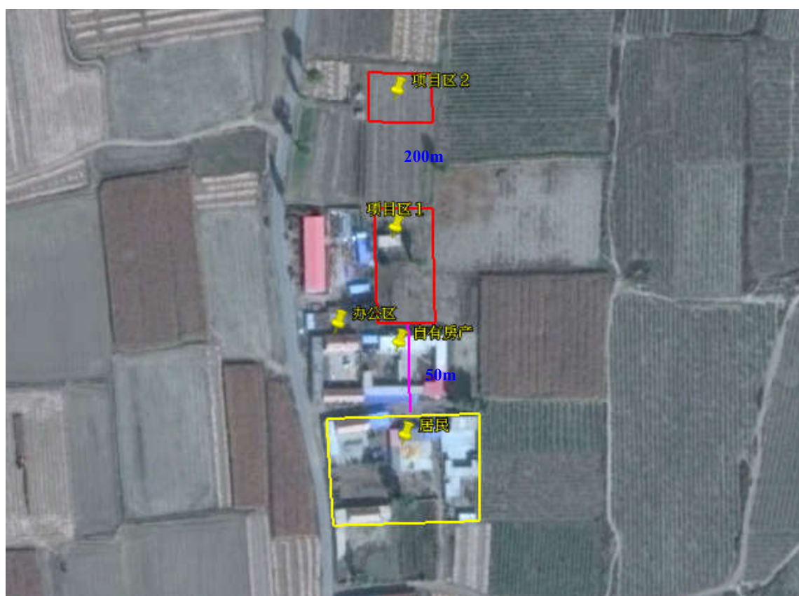
图 2 环保目标图